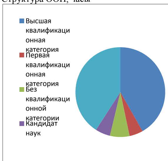
Структура ООП, часы