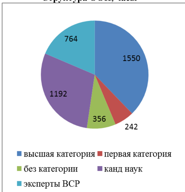
Структура ООП, часы