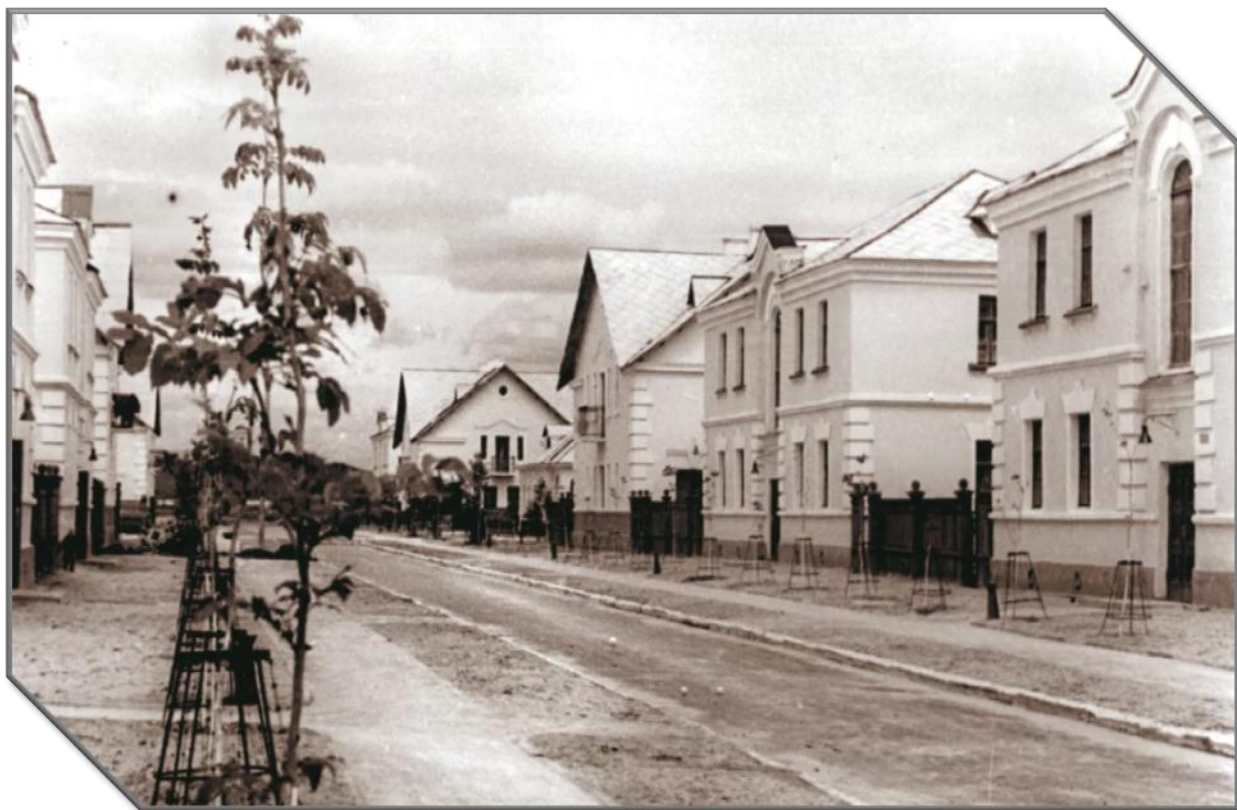
Рисунок 3 - Комплекс жилых зданий по переулку Щеглова