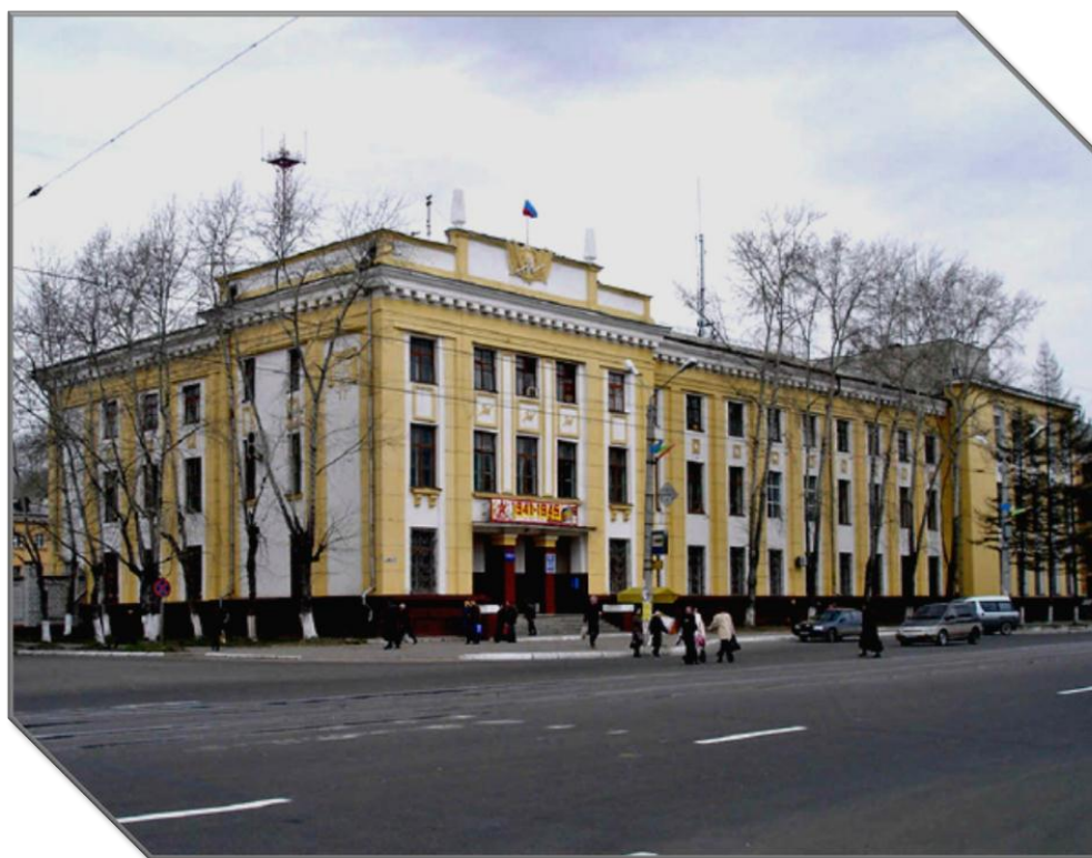
Рисунок 2 - Здание главпочтамта проспект Мира, 27 разгадать шифровку азбукой Морзе, полученные слова укажут направление движения.

Основное задание «Символы эпохи»: найти и перечислить на фасаде здания почтамта элементы советской символики.