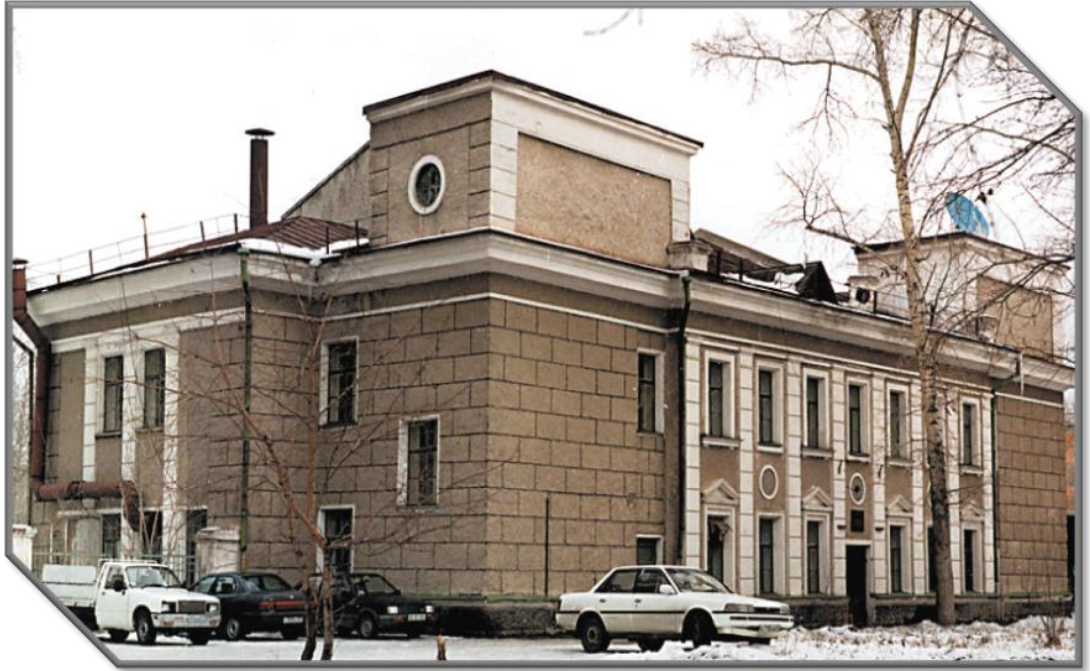
Рисунок 3 - Здание радиокомитета (сейчас телецентра) ул. Молодогвардейская,6

Основное задание «Прямой эфир»: в импровизированном прямом радиозэфире поздравить город и его жителей с юбилеем (90-летием)