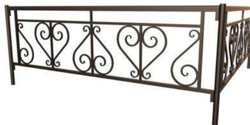
Заборы и оградки