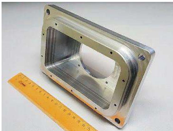
Д16Т Цена: 5500 руб.