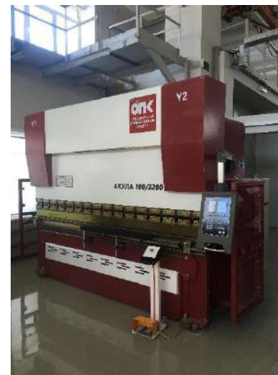
Листогиб с ЧПУ

КГА ПОУ «ГУБЕРНАТОРСКИЙ АВИАСТРОИТЕЛЬНЫЙ КОЛЛЕДЖ Г. КОМСОМОЛЬСКА-НА-АМУРЕ (МЕЖРЕГИОНАЛЬНЫЙ ЦЕНТР КОМПЕТЕНЦИЙ)»