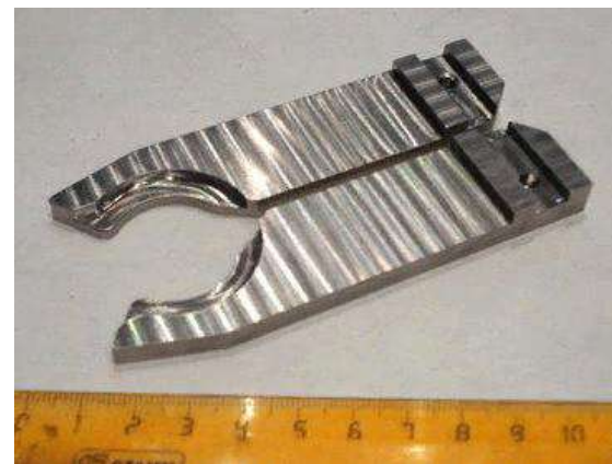
12X18H10T. Цена: 1850руб

КГА ПОУ «ГУБЕРНАТОРСКИЙ АВИАСТРОИТЕЛЬНЫЙ КОЛЛЕДЖ Г. КОМСОМОЛЬСКА-НА-АМУРЕ (МЕЖРЕГИОНАЛЬНЫЙ ЦЕНТР КОМПЕТЕНЦИЙ)»