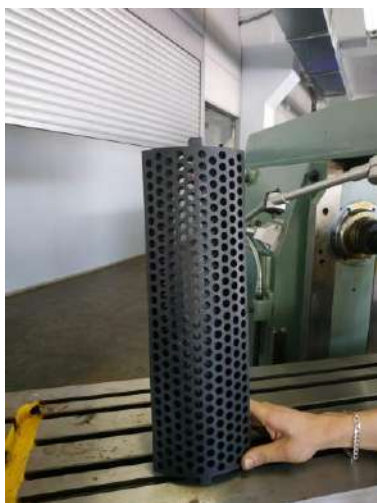
Капролон Цена: 1000 руб.