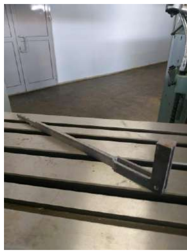
Сталь45 Цена: 500 руб.