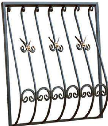
Решетки на окна