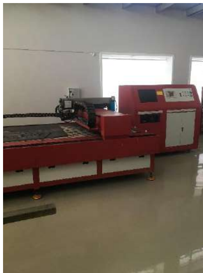
Станок лазерной резки