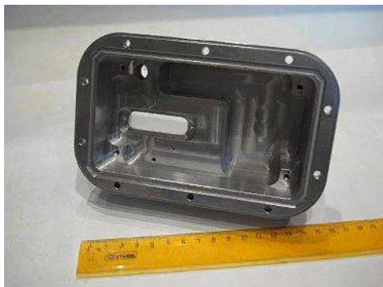
Сталь 45 Цена: 4500 руб.